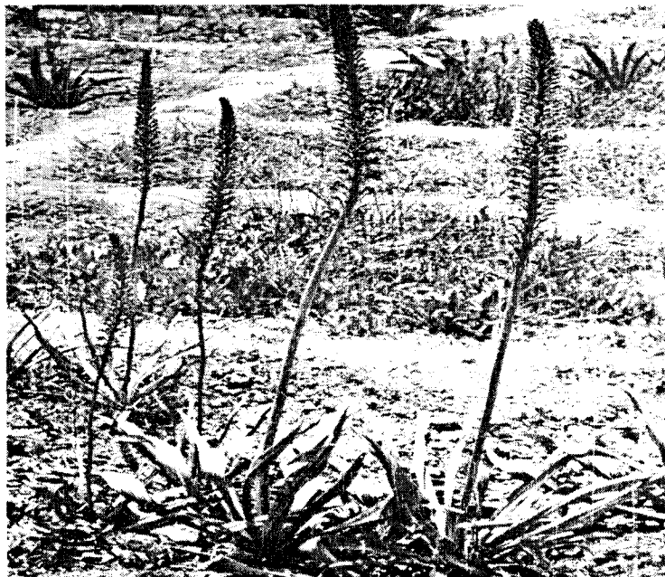
Şək. 3. Görkəmli çiriş kolleksiya sahəsində çiçəkləmə vaxtı.

Çiçəkləri salxımşəkilli olub üzərində 180-ə qədər ağ rəngli çiçəkləri olur. Uzunluğu 25 sm-dir, bitkinin gövdəsi (çiçək oxu ilə birlikdə) 125 sm-dir (Şəkil 3).